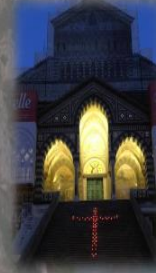
La cruz de luces en la escalera del Duomo de Amalfi

Los Battenti di Amalfi, en cambio, son los que acompañan en silencio a Jesucristo muerto en procesión. Sus luces doradas crean un marco sugerente para las estrechas calles del pueblo costero entre luces apagadas y zonas de sombra.