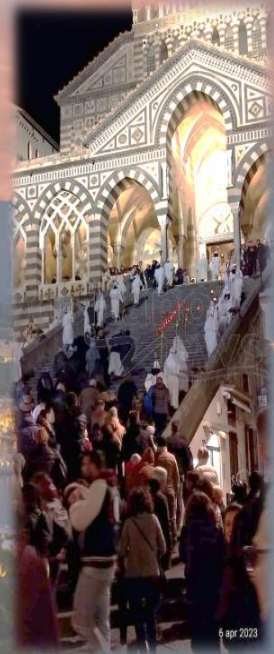
6 apr 2023

Además de la alternancia del "solo" y el "tutti" está el acoplamiento polifónico de todas las voces en sencillas pero austeras combinaciones cordales de terceras, quintas y octavas, procedimiento que sugeriría un tipo de "discant" ya conocido en los siglos XII y XIII.